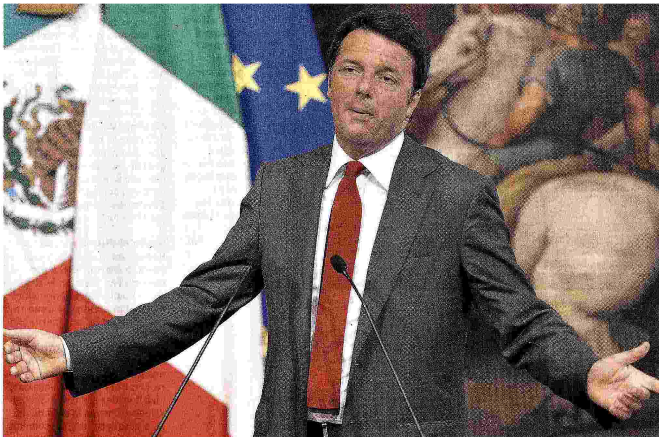
Renzi è presidente del Consiglio dal 22 febbraio 2014 e segretario del Pd dall'8 dicembre 2013

Questo è un Paese moderato, vince chi occupa il centro. In Liguria la Paita non ha perso per colpa del candidato di Civati ma perché nell'ultima settimana il 5% è andato verso Toti