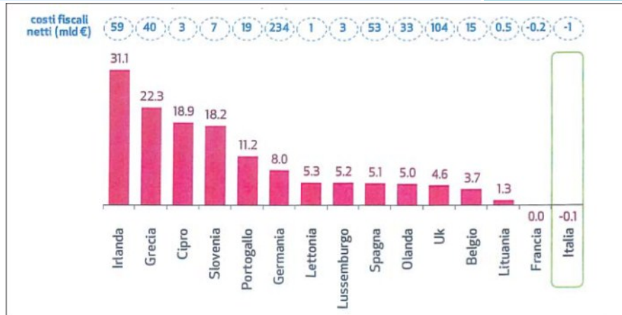
Interventi pubblici nel settore bancario in Europa.